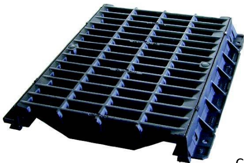
CA 1070 FLV