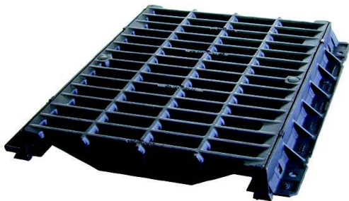
CA 1070 FLV