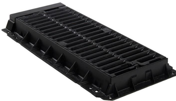
CA 1040 FLV

De roosterelementen kunnen geplaatst worden op lokaal gestorte goten en kunnen mee ingestort worden met ankerbouten.