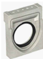
begin-/eindplaat met aansluiting