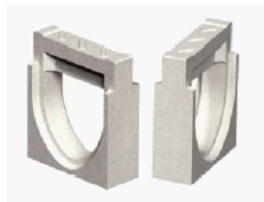
aparter t.b.v. omkeren stromingsrichting