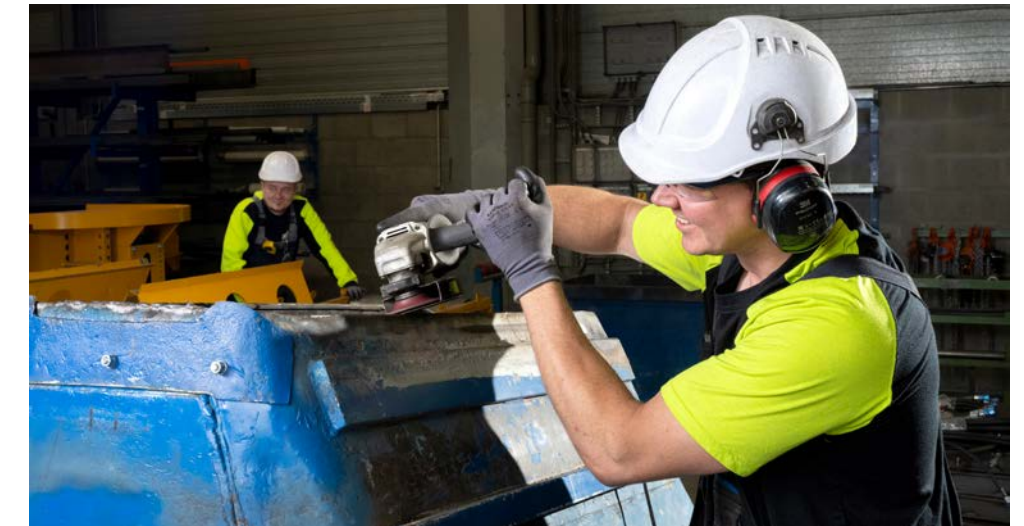
De TBS-SVA Groep is een leerbedrijf, waar talent en motivatie belangrijker is dan een diploma.

Als leerbedrijf biedt de TBS-SVA Groep jongeren daarom de mogelijkheid om tijdens het leertraject het bedrijf te leren kennen en ervaring op te doen. “Daarbij vinden wij talent en motivatie belangrijker dan een diploma”, zegt Willy. “In het algemeen geldt bij ons: als we potentie zien, krijgt iemand bij ons een kans, bijvoorbeeld om intern de laatste stappen te leren. Met de juiste insteek en de juiste begeleiding kan zo iemand zich verder ontwikkelen binnen onze organisatie. Ik vind het belangrijk dat we daar als bedrijf voor open staan”, zegt Willy en vertelt dat de vacatureteksten daar zelfs op aangepast worden, zodat het mensen niet afschrikt en ze juist geneigd zijn om te laten zien wat ze in hun mars hebben.