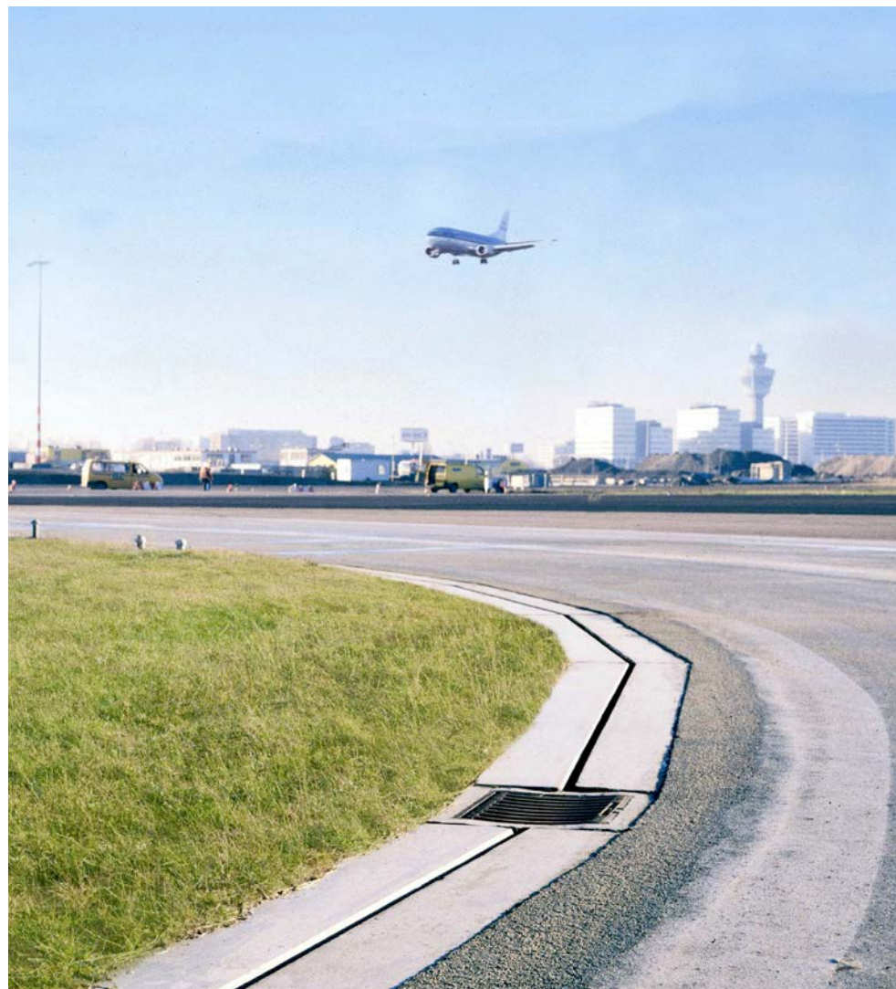
Bij de TBS-SVA Groep werk je onder andere aan grootschalige afwateringsprojecten zoals op luchthavens en containerterminals.

Tekst Susan Peek