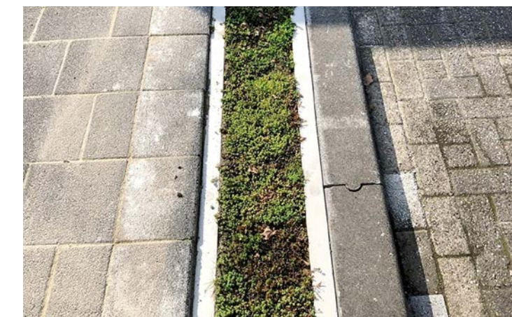
Cool City Drainingoot.