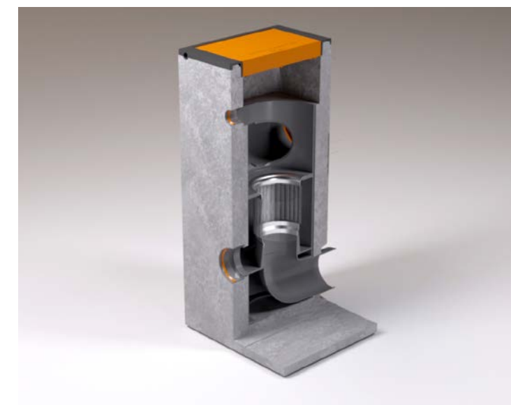
Cycloon filterput kolk.