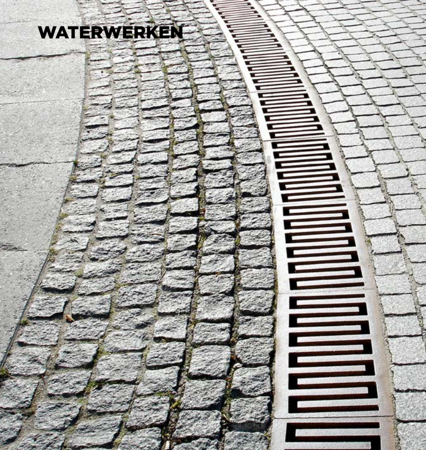
TBS-SVA is samen met DDC nog groter in binnenstedelijke design afwatering.