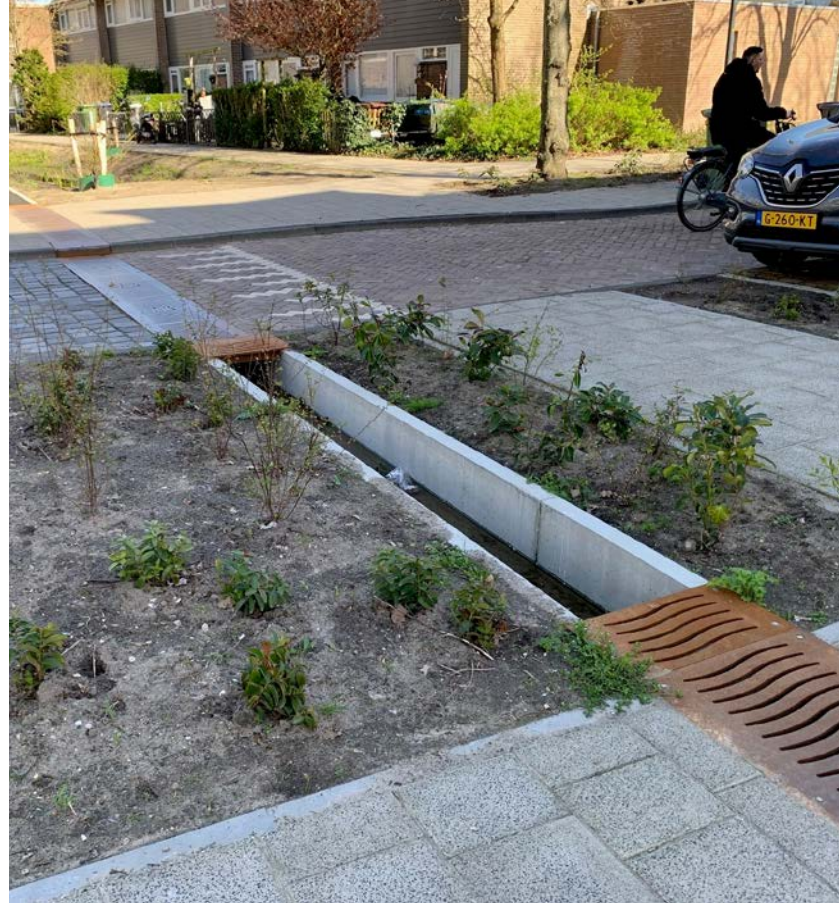
Een project van DDC in Leiden, waar een eigen ontworpen roostergoot onderdeel uitmaakt van de klimaatbestendige herinrichting van de Gasthuiswijk.

in best passende afwateringsproducten voor de markt