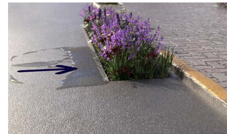
AquaCare: de klimaatadaptieve productenrange van de TBS-SVA Groep: Mini Rain Garden.

"Het mag duidelijk zijn: met de toevoeging van DCC AquaCare aan onze groep, zetten we opnieuw een belangrijke stap in het kader van samenwerken op het gebied van klimaatadaptatie", zegt Willy. "We bereiken hiermee voortaan ook de ingenieursbureaus en de landschapsarchitecten, die een grote rol spelen bij het inrichten van openbare ruimten. En dat is nodig ook. Want de wereld om ons heen en het klimaat in het bijzonder is enorm onderhevig aan veranderingen. Dat kunnen we niet alleen, daarom trekken we gezamenlijk op in de klimaatadaptieve opgave waar Nederland voor staat. Dankzij de unieke combinatie van innovativiteit en betrouwbaarheid, kunnen we deze uitdagingen het hoofd bieden. We hebben met deze overname betere toegangsmogelijkheden bij diverse marktpartijen waar we kunnen adviseren en zo de best passende afwateringsproducten op de markt kunnen zetten." ●